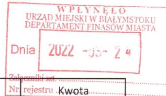
Tabela 1.15 Kwota wypłaconych środków pieniężnych na świadczenia pracownicze